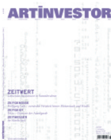
Cover der ersten internationalen Ausgabe des ARTINVESTOR

Die erste Produzenten-Kunstmesse München, das Festival Island of Art wird vom 1. bis 4. November 2007 im Aktionsforum der Praterinsel stattfinden. Über 50 Künstler, allesamt Absolventen der Münchner Kunstakademie, werden auf 2000 kojenfreien Quadratmetern Einblicke in deutsche und internationale Nachwuchskunst bieten. Die Veranstaltung wird durch das Bayerische Staatsministerium für Wissenschaft, Forschung und Kunst sowie durch die Golart Stiftung München und ARTINVESTOR gefördert. Schirmherr ist Oberbürgermeister Christian Ude. Info: www.larc-derbogen.de