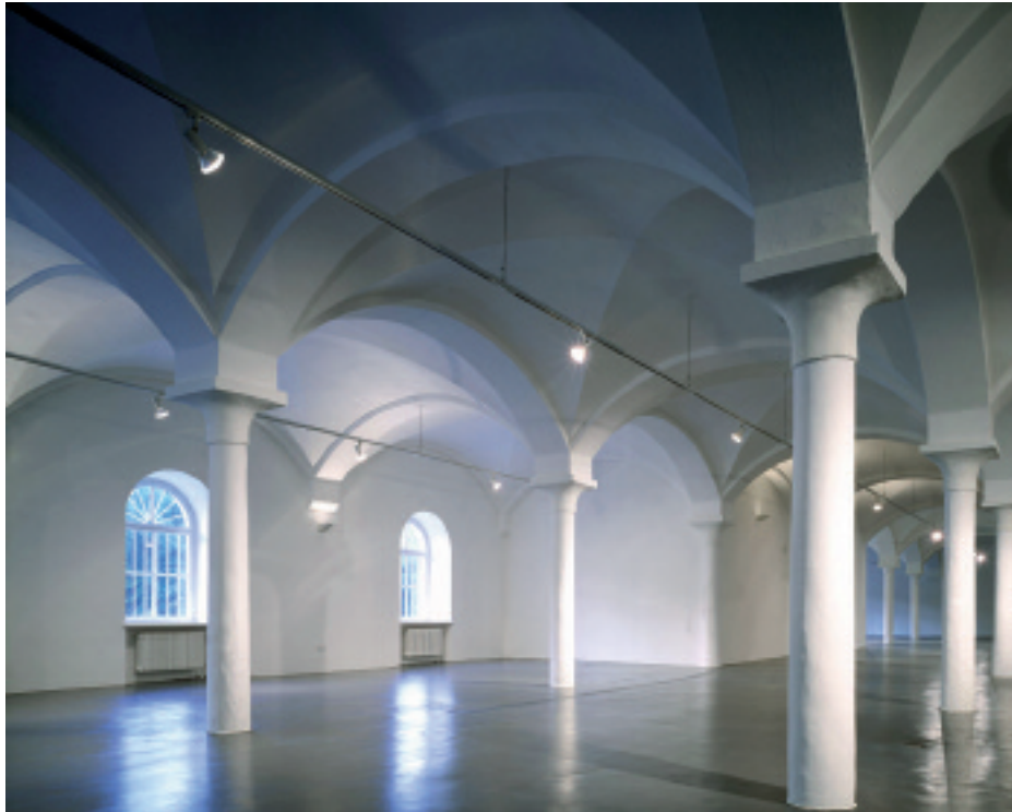
Teil der Veranstaltungsräume: die Füllhalle im Aktionsforum der Praterinsel